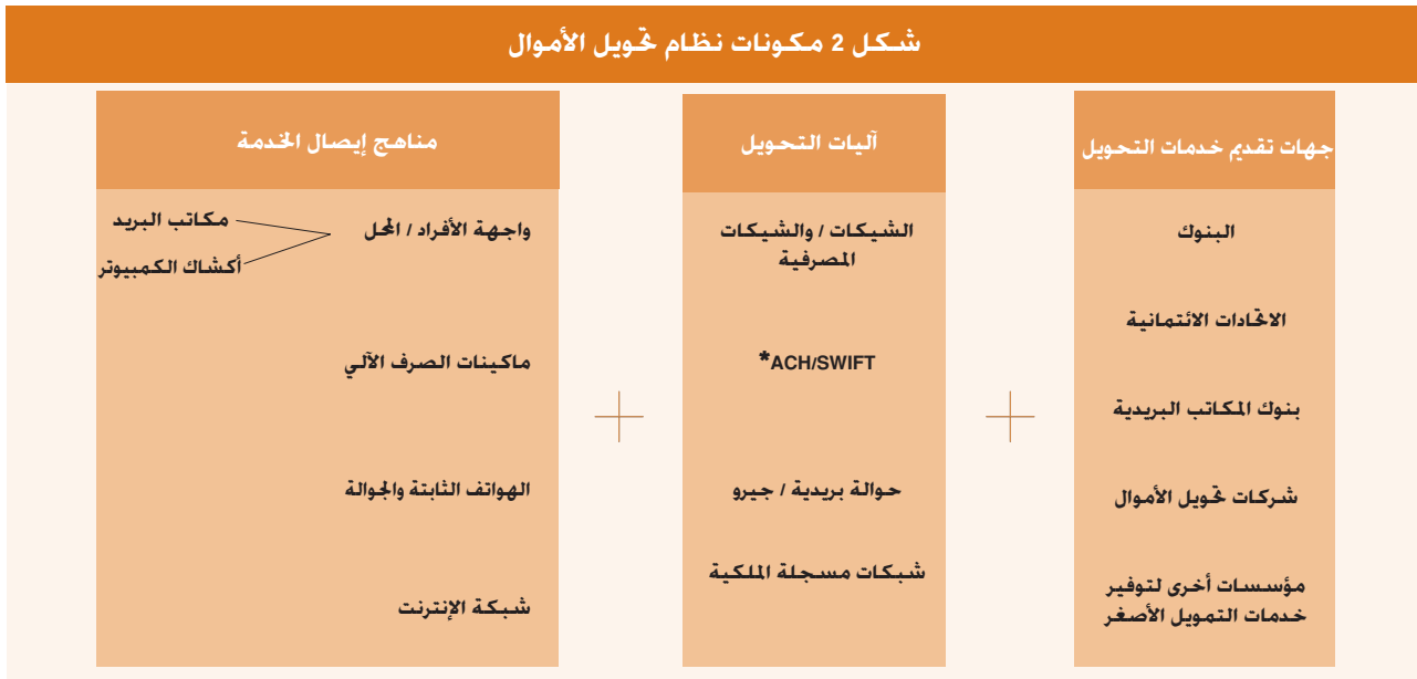
شكل 2 مكونات نظام تحويل الأموال

* ACH = المقاصة التلقائية الوطنية SWIFT = جمعية الاتصالات السلكية واللاسلكية بين المصارف على مستوى العالم في الميدان المالي