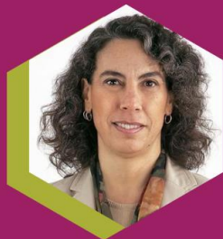
Carolina Trivelli Economista, Ex Ministra de Desarrollo Social e Inclusión de Perú

PANEL: Soluciones efectivas para la inclusión financiera de las mujeres en América Latina y el Caribe