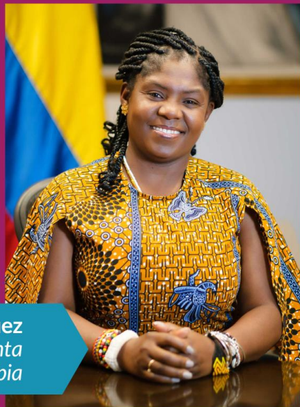
Francia Márquez Vicepresidenta de Colombia